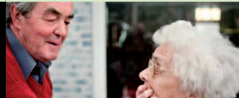
Verdwaald in het geheugenpaleis