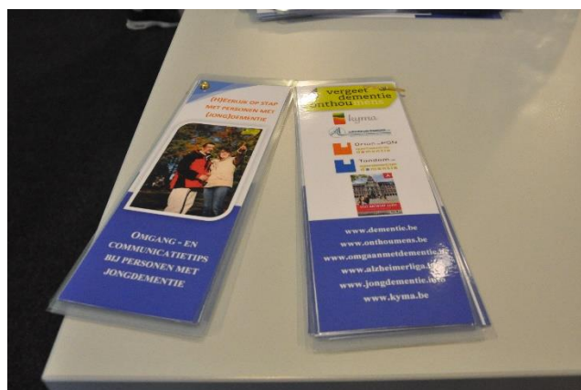
klapper Communicatietips jongdementie

Ter voorbereiding hierop werkten Tandem en ECD Orion ism PGN een vormingsnamiddag uit voor de Antwerpse stadsgidsen die deze mensen zou rondleiden.