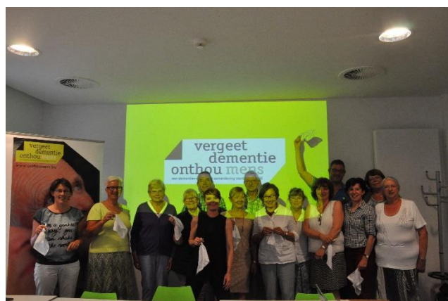
vorming aan stadsgidsen over jongdementie

Kyma ism Alzheimer Liga nam het initiatief om een culinaire daguitstap naar Antwerpen te organiseren voor mensen met dementie en hun familie.