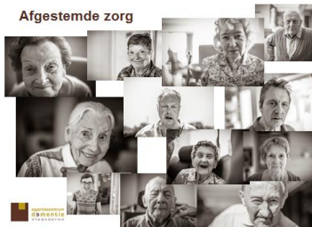
BOEK: Ik, jij, samen mens – Een referentiekader voor kwaliteit van leven, wonen en zorg voor personen met dementie

Afgestemde zorg voor de persoon met dementie