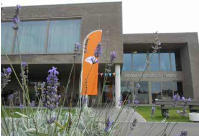
WZC De Notelaar

014 26 26 20, info@wzczilverlinde.be , www.wzczilverlinde.be